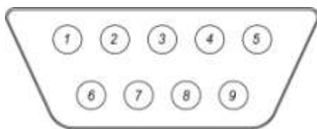
Рисунок А.2–Разъем тензодатчика (со стороны терминала) «Мама» (4-ех проводная схема подключения) нумерация со стороны монтажной части. Для подключения датчика используется разъем «Папа» (входит в комплект поставки)