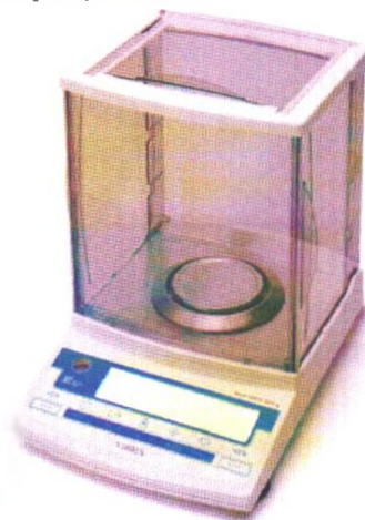
Рисунок 1 – Общий вид весов неавтоматического действия НТ

Принцип действия весов основан на преобразовании частоты вибрации акустического весоизмерительного датчика, возникающей при его растяжении или сжатии под действием взвешиваемого груза, в цифровой сигнал, изменяющийся пропорционально массе взвешиваемого груза. Результаты взвешивания выводятся на дисплей.